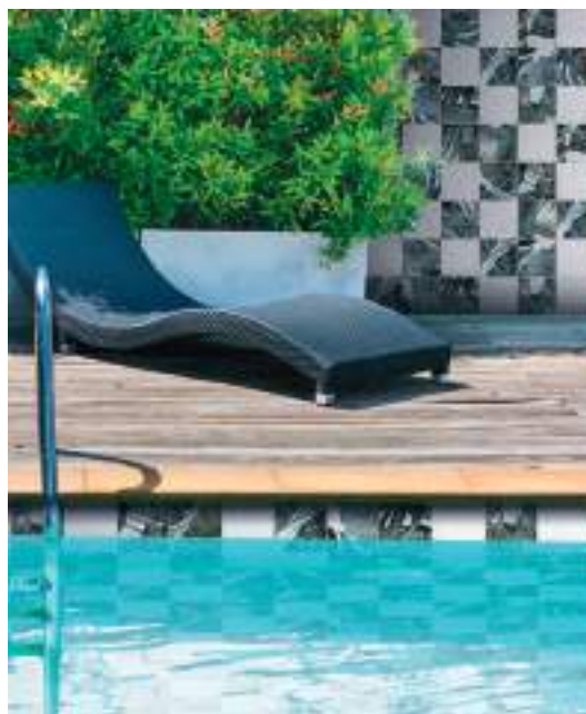
JAVA - Musa - Foam White / 15x15 cm / 6"x6"