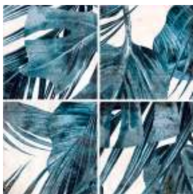
Musa 15x15cm / 6" x 6"