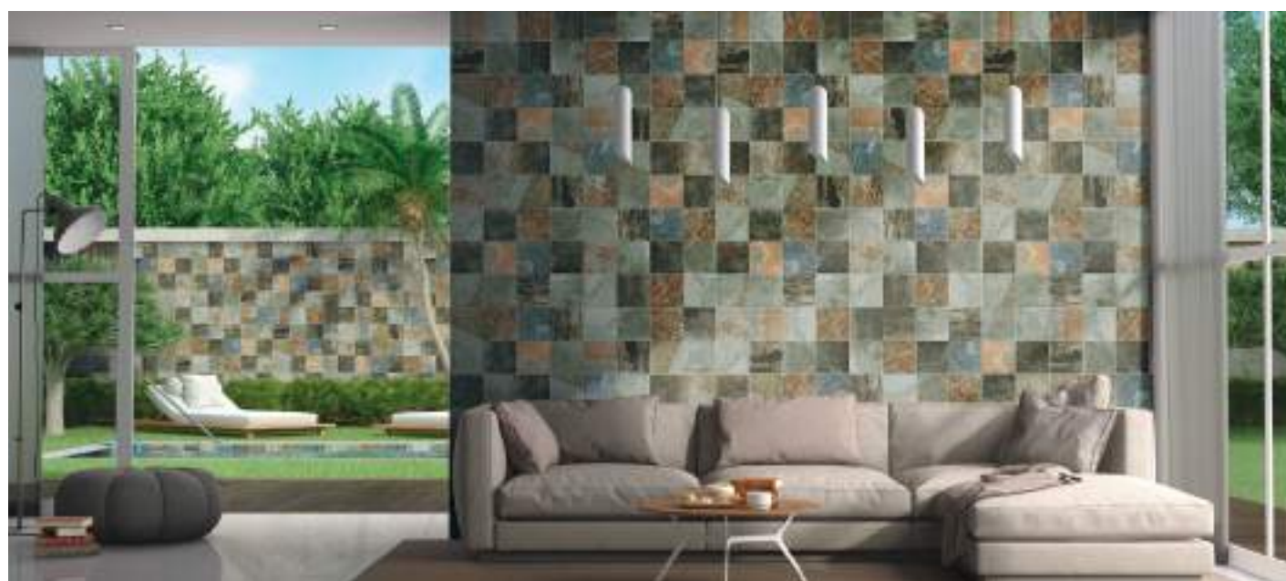
JAVA - Silky Sand - 15x15 cm / 6" x 6"

Sensación de continuidad tanto para el interior de la piscina, como para el entorno que la rodea.