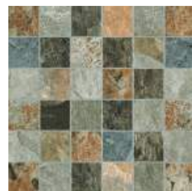
Silky Sand Malla 28,5x28,5cm / 11" x 11" Mosaico 4,6x4,6 / 2" x 2"

Sense of continuity both for the interior of the pool and for the pool surround.