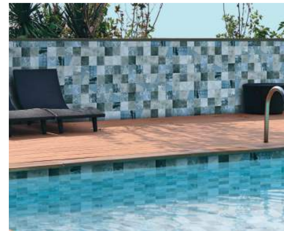
JAVA - Sea Blue - 15x15 cm / 6" x 6"