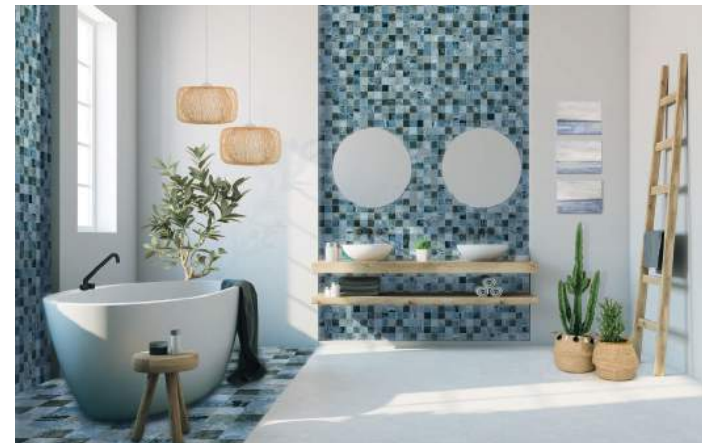
JAVA - Sea Blue - 15x15 cm / 6" x 6 - 4,6x4,6 cm / 2" x 2"