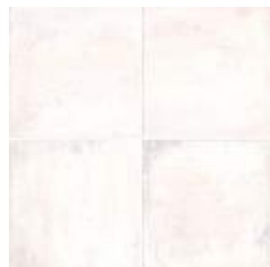
Foam White 15x15cm / 6" x 6"

Una piscina decorativamente diferente y con la máxima garantía de seguridad.