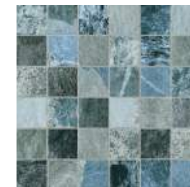
Sea Blue Malla 28,5x28,5cm / 11" x 11" Mosaico 4,6x4,6 / 2" x 2"