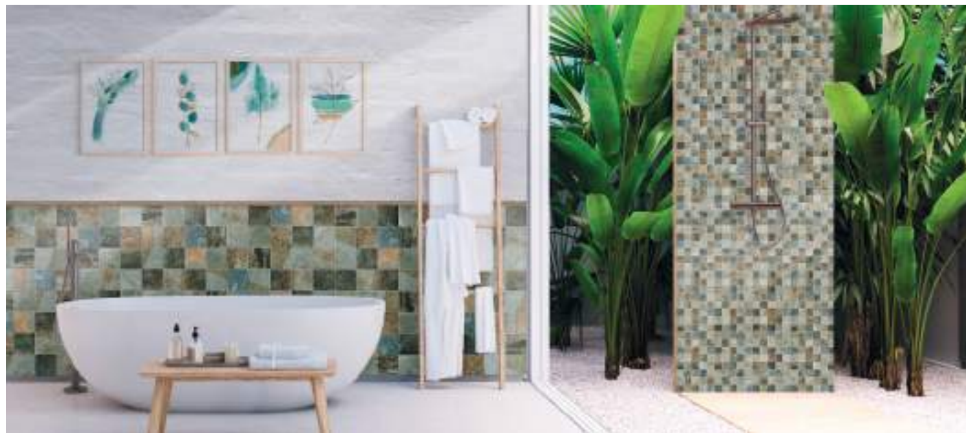
JAVA - Silky Sand - 15x15 cm / 6" x 6 - 4,6x4,6 cm / 2" x 2"