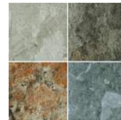
Silky Sand 15x15cm / 6" x 6"