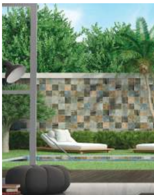
JAVA - Silky Sand - 15x15 cm / 6"x6"