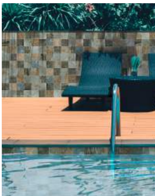
JAVA - Silky Sand - 15x15 cm / 6"x6"